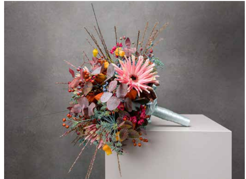
BP 2020, Aufgabe 5: Zu einer ausgewählten Modeikone musste ein passender Brautstraus erarbeitet werden, welcher an der Hochzeitsmesse in Zürich präsentiert wurde. Werkstück: Ramona Sommer

Mit der Änderung der Berufsbezeichnung vom Blumengeschäftsinhaber zum Floristen wurde das Berufsbild und seine Ausbildung verstärkt zum Thema. 1930