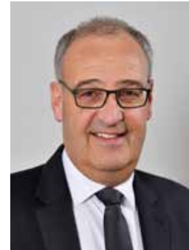
Guy Parmelin Bundespräsident

«Sie, die Floristinnen und Floristen, leisten so einen immens wichtigen Beitrag zu unserem täglichen Wohlbefinden und erfreuen unser Gemüt.»