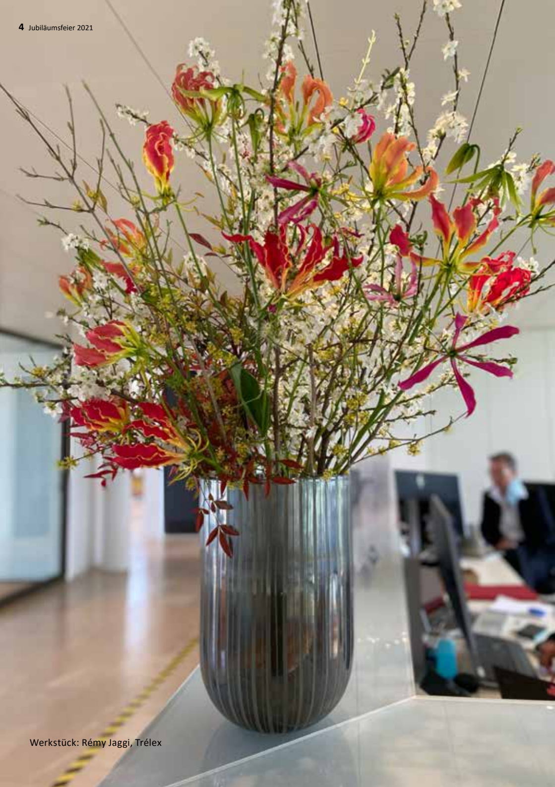
Werkstück: Rémy Jaggi, Trélex