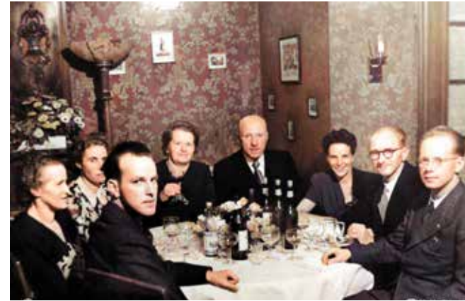
Verbandsmitglieder und ihre Frauen im trauten Kreis an der Generalversammlung von 1940. Der Zweite Weltkrieg hatte eben begonnen.

Darum tun wir uns zusammen!». Fünf Monate später erhoben 100 Mitglieder an ihrer ersten Generalversammlung ihre Gläser auf den neuen «Verband Schweizerischer Blumengeschäftsinhaber», der ab 1928 auf «Schweizerischer Floristenverband» geändert wurde.