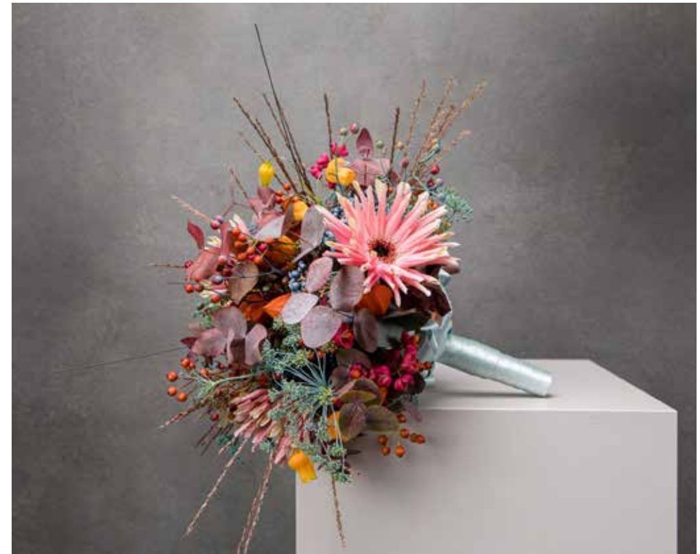
Esame superiore 2020, compito 5: bisognava creare un mazzo da sposa adatto ad un' icona della moda a scelta, che in seguito veniva presentato durante la fiera degli sposi a Zurigo. Lavorazione: Ramona Sommer.

Cambiando il nome da «proprietario di negozio di fiori» a «fiorista» la tematica del quadro professionale e la sua formazione di base diventa sempre più importante. Nel 1930 viene introdotta la legge federale per l'apprendista fiorista, nel 1942 un regolamento per l'esame di mae-