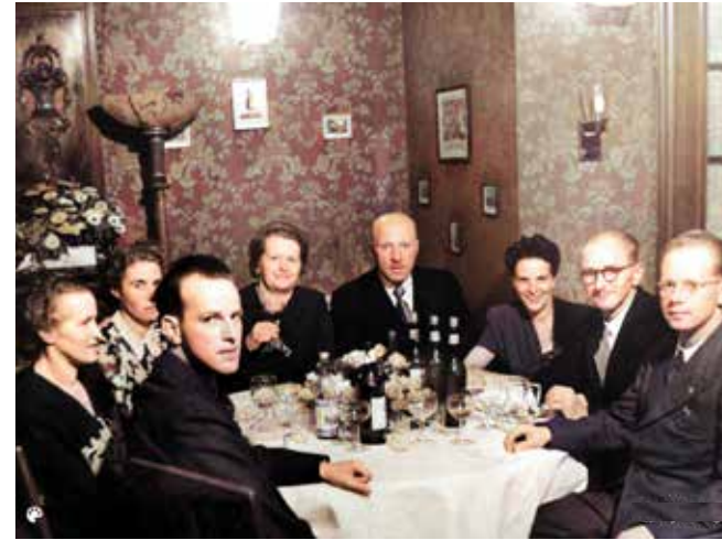
I membri dell'Associazione con le loro mogli durante l'assemblea del 1940. Era appena iniziata la seconda guerra mondiale.

ci dobbiamo riunire!» Cinque mesi più tardi si trovarono 100 membri e alzarono il bicchiere per brindare all' «Associazione Svizzera proprietari di negozi di fiori» che nel 1928 cambiò nome in «Associazione Svizzera dei Fioristi».