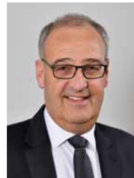
Guy Parmelin Presidente della Confederazione